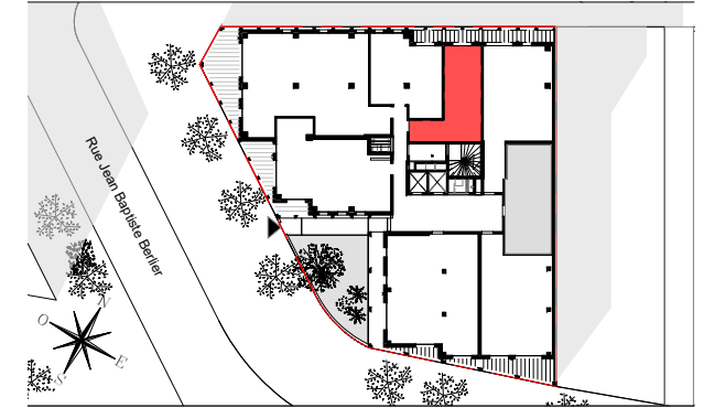
STUDIO n°1027 au 2ème étage